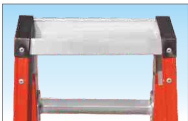
Robusta vaschetta porta-oggetti in alluminio dimensioni cm. 9 x 34 e profonda 4 cm.