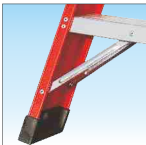
Base rinforzata con nervature anti-urto e piedino anti-scivolo