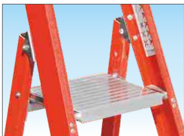
Piattaforma realizzata in robusto profilato di alluminio dimensioni mm. 290 x 260